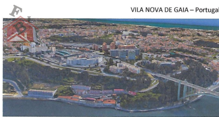
VILA NOVA DE GAIA – Portugal